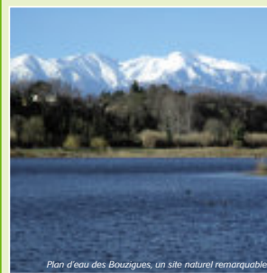
Plan d'eau des Bouzigues, un site naturel remarquable.

Qui avait une terre au Bouzigues était riche ! C'était avant l'exploitation industrielle du site par la SATP. Racheté par la commune pour un franc symbolique, la gestion de cet espace naturel a été confiée à Perpignan Méditerranée. Connecté à la Têt et doté d'un plan d'eau, ce site possède un potentiel écologique à protéger et à valoriser. En mai 2005, la signature d'une convention provisoire de pêche avec la fédération départementale des P.-O. a marqué la première étape d'un processus qui vise à fixer les usages futurs de ce lieu. Pour en refaire un espace naturel apprécié de ses habitants, riche et vivant.