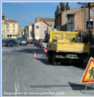
Élargissement de l'avenue général de Gaulle.