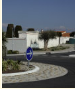
Le nouveau rond point de Tramonti en entrée de commune.

Rue Paul Astor, le nouveau giratoire réalisé par l'Agglo permet un meilleur accès aux lotissements environnants. Allié à un rétrécissement de la chaussée et à l'ajout d'une chicane, il induit aussi une réduction importante de la vitesse des véhicules en entrée de village. La sécurité mais aussi le confort des piétons ont guidé les travaux, l'espace gagné sur la route ayant servi à élargir les trottoirs. En prime, une entrée de ville plus esthétique !