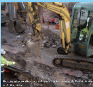
Tous les réseaux d'eau ont été refaits sur les avenues de l'hôtel de ville et du Roussillon.

Préalable à la rénovation urbaine des avenues de l'hôtel de ville et du Roussillon, les travaux en sous-sols de l'Agglo pour rénover les réseaux d'eaux ont été conséquents. Plus de 400 000 € pour les eaux usées, 200 000 € pour l'eau potable et 550 000 € pour le pluvial : toutes les canalisations ont été refaites sur des longueurs atteignant 400 m, avec plusieurs centaines de branchements. Le chantier a duré presque un an, du 18 octobre 2004 au 26 avril 2005. Aujourd'hui, tous les réseaux sont à neuf.