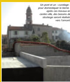
Un pont et un « cuvelage » pour domestiquer la berne : après ces travaux en centre ville, des bassins de stockage seront réalisés vers l'amont.

La catastrophe naturelle de 1999 a marqué les esprits. Décrétés d'utilité publique, les travaux entrepris par l'Agglo depuis 2005 sur le ravin de la Berne visent à ralentir, intercepter et stocker les eaux dans une zone prévue à cet effet lors de tout épisode de crue torrentielle. 3 M€ sont investis pour réaliser un bassin de stockage de 135 000 m 3 , un chenal de dérivation rejoignant la Têt, et divers ouvrages connexes destinés à maîtriser les flux. Opérationnel en 2007, ce système de protection contre les inondations bénéficiera à Pézilla, ainsi qu'à toutes les communes en aval, soit près de 16500 habitants.