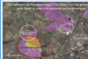
De l'aéroport de Perpignan jusqu'à St-Estève, c'est un grand pôle Santé et soins à la personne qui se développe...

Ce pôle d'activités généraliste, planifié par la ville de Saint-Estève, est en plein essor sous l'impulsion de Perpignan Méditerranée. L'expansion (37 ha au total d'ici deux ans) va permettre, à l'échelle locale, de répondre aux nombreuses demandes d'implantation d'entreprises stéphanoises et à l'échelle intercommunale, de trouver un complément à l'espace Polygone commercialisé en quasi totalité. Enfin, un pôle « Santé et Soins à la personne » est en développement sur le Nord-Ouest de Saint-Estève pour répondre aux besoins liés au vieillissement de la population. Ce projet à vocation médicale qui complètera le pôle d'activité économique La Mirande, en continuité de la Pinède et dans un cadre de vie remarquable avec l'étang, est un projet prioritaire depuis l'adhésion à l'Agglo. Il a même essaimé puisque Perpignan a souhaité l'étendre à son territoire jusqu'à Torremilla Fraternité, près de l'aéroport.