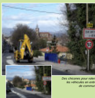
Des chicanes pour ralentir les véhicules en entrée de commune.

Afin de réduire la vitesse en entrée de commune, un ralentisseur a été aménagé par l'Agglo au niveau du croisement avec le chemin de Saint Martin. Des chicanes interrompent le caractère rectiligne de la voie et permettent aux véhicules venant des voies perpendiculaires de s'insérer plus facilement, ce qui sécurise aussi le carrefour existant. Route de Corbère, la chaussée a été renouvelée sur 400 m. En fin d'année, l'avenue de la gare devrait être renouvelée.