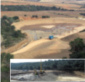
Le bassin de la « vigne de désiré » ille bien-nommé sur le Manadeil.

La création d'une retenue sur le Manadeil et du bassin du Mas Blancs en 2005 ne représente que la première étape d'un chantier de plus de 3 M € que l'Agglo va mener jusqu'en 2011. Décreté d'utilité publique après la catastrophe naturelle de 1999, il va entraîner la création de quatre autres bassins de rétention, la rehausse de la RD1 et la réfection d'un pont sur celle-ci. D'autant que ces ouvrages bénéficieront à Baho, à Pézilla-la-Rivière sur le territoire duquel ils sont implantés, mais aussi à Villeneuve-de-la-Rivière et à toutes les autres communes en aval.