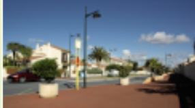
L'avenue de Lamans et ses grands trottoirs.

Des îlots centraux avec des espaces verts pour l'esthétique, des trottoirs pour la sécurité des piétons, des carrefours d'accès améliorés pour celle des autos : de l'avenue du Carigou au giratoire de la RD31, ce sont plus de 800 m de l'avenue de Lamans qui ont été réaménagés entre septembre 2002 et janvier 2004. L'accès à la Mairie annexe et aux commerces de la rue Surcouf est aussi facilité avec la création de places de parking.