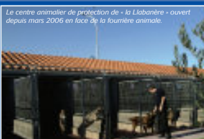
Le centre animalier de protection de « la Libanère » ouvert depuis mars 2006 en face de la fourrière animale.

Prolifération de chats, abandon d'animaux domestiques record : notre territoire a besoin d'un dispositif performant pour remédier à ce problème. Perpignan Méditerranée s'y attelle : une charte a fédéré cinq associations partenaires, une fourrière intercommunale gère la divagation d'animaux sur l'ensemble des communes membres, tandis que le Centre Animalier de Protection (CAP), achevé fin mars 2006, va permettre d'améliorer les soins et les capacités d'accueil : 65 chiens et 72 chats en plus.