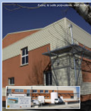
Evora, la salle polyvalente, sort du bois...

Evora, servante de Diane, déesse de la nature : c'est par son nom que la nouvelle salle polyvalente de Baho garde la trace de l'histoire agricole du bâtiment, ancienne cave coopérative. Pour le reste, la rénovation a dégagé un ensemble d'une belle homogénéité, d'aspect moderne. D'ailleurs, son système de toit chauffant est une première dans le Sud de la France. Sa vaste salle de 600 m 2 , dont une scène de 100 m 2 , bénéficie du traitement acoustique des plafonds et des murs, revêtus de panneaux phoniques. Achievé en mars 2006, cet équipement à 1,2 M€, aidé pour tiers par l'Agglo, va réjouir tous les bahotencs.