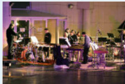
Avant de jouer tous ensemble, une préparation minutieuse.