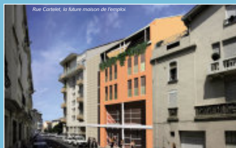
Rue Carlelet, la future maison de l'emploi.

9 espace méditerranée. Parallèlement, rue Carlelet, l'Agglo a démarré un chantier de construction. Avant la fin 2006, sur 1350 m 2 et 4 étages, l'emploi disposera alors de sa Maison.