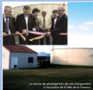
La bache de stockage lors de son inauguration à l'occasion de la fête de la Science.

En 2001, Le Soler effectue un nouveau forage au lieu dit « coulomines d'Oms ». La commune rejoint l'Agglo en 2003 et le projet est poursuivi par Perpignan Méditerranée. Un réservoir de 1500 m 3 et un système de pompage complètent bientôt l'installation. Les travaux se terminent en mai 2004. Pour l'ouverture de la Fête de la Science, cette année-là, le nouvel ouvrage est inauguré. Depuis, les Solériens boivent l'eau du Soler.