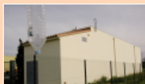
Château d'eau à Fenvers. La bache de stockage est creusée sous le bâtiment technique de surface.

Contrairement au château d'eau, la bache de stockage est un réservoir enterré. Sous le discret bâtiment technique, 800 m 3 d'eau potable sont pourtant disponibles. Construit par l'Agglo entre fin 2004 et fin 2005 au lieu dit «les tilleuls», l'ouvrage comprend une station de surpression et une unité de traitement de l'eau. Ce site de production d'eau potable, dont le forage date de 2001, sert principalement aux canouhards.