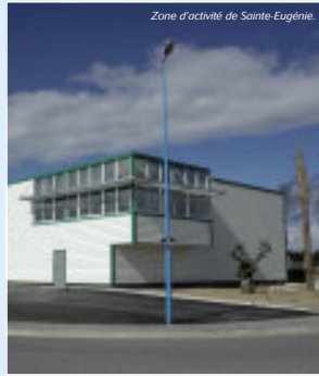
Zone d'activité de Sainte-Eugénie.

Et de 4 ! Le Soler avait créé cette zone en deux tranches. Bien située, avec son ouverture sur la vallée de la Têt, la proximité de St Charles et son cadre paysager, Sainte Eugénie a tenté de nombreuses entreprises nouvelles. Perpignan Méditerranée qui assure le développement a réalisé une 3ème tranche en 2004. Devant un succès marqué par de nouvelles demandes d'implantation, l'Agglo entame courant 2006 l'Acte 4 du développement économique de Sainte Eugénie.