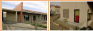
L'extension de l'annexe scolaire en cours de réalisation et la maternelle.

À la prochaine rentrée, une classe double CM1-CM2 et une CE2 viendront s'ajouter aux 4 classes de l'annexe scolaire. Située rue du Moulin, jouxtant la piste cyclable, elle a été créée en 2003 pour délester l'ancienne école primaire. La construction actuelle d'un nouveau bâtiment a bénéficié de près de 100 000 € d'aide de l'Agglo sous forme de fonds de concours. Les élèves de maternelle peuvent quant à eux dormir tranquilles : les travaux d'étanchéité du dortoir et le creusement d'un petit canal d'évacuation bordant le bâtiment ont été achevés en septembre 2005. Le financement provenait pour moitié de l'Agglo.