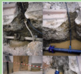
Dernière tranche de travaux des branchements de plomb.

La loi oblige les communes à remplacer les réseaux d'eau en plomb, pour s'affranchir des risques de saturnisme, une maladie du système nerveux. Initié par le Conseil municipal de Peyrestortes en 2001, le renouvellement de 350 branchements particuliers en plomb sur le vieux village a été réalisé par l'Agglo depuis 2003. Au rythme de 110 rénovations par an, ce projet soutenu par le Conseil Général et l'Agence de l'Eau s'achève en juin 2006, pour une parfaite sécurité des usagers.