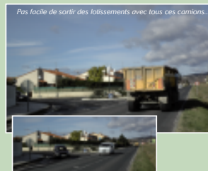
Pas facile de sortir des lotissements avec tous ces camions...

Ce projet vise à améliorer la sécurité d'accès aux lotissements Coste Rousse, Colomine et Pépinière, en aménageant des ronds-points sur la RD 614, empruntée par de nombreux poids lourds. Sur les quelques 1200 m qui concernent le projet, le tracé de l'avenue devrait aussi être modifié. L'idée est d'écarter la route des habitations afin de créer un grand espace vert de plusieurs hectares qui permettra la réimplantation d'essences d'arbres disparus de ces lieux (mûriers, ormes, caroubiers...). Des cheminements piétons, cyclistes et des aires de loisir y seront implantés. Les études, initiées en 1998 par la commune, reprises par l'Agglo en 2003, ont débouché sur une enquête d'utilité publique en cours, avec la perspective d'une ouverture de chantier en septembre 2006.